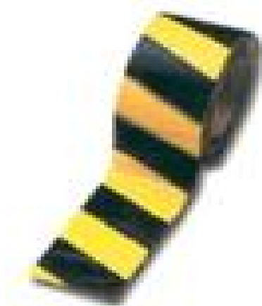
(FITA ZEBRADA ADESIVA)