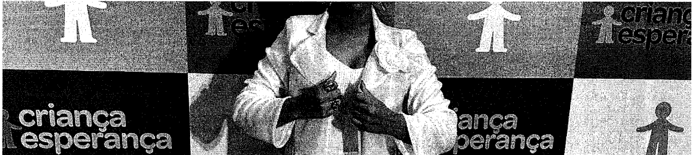
Cantora Lia Clark foi uma das atrações do 'Criança Esperança'