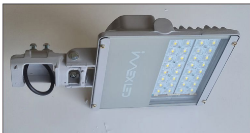
Visor Frontal em Vidro 4mm