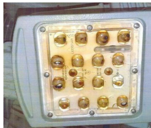
Visor Frontal em Termoplástico com Aditivo Ant - Amarelamento